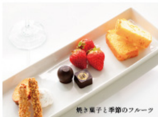
焼き菓子と季節のフルーツ