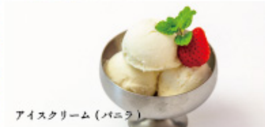
アイスクリーム (バニラ)