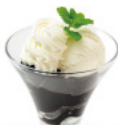
珈琲ゼリー ～香り高さ珈琲ゼリーマリアージュ～