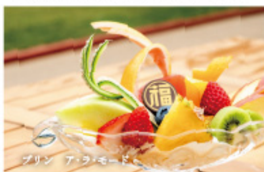
プリン ア・ラ・モード