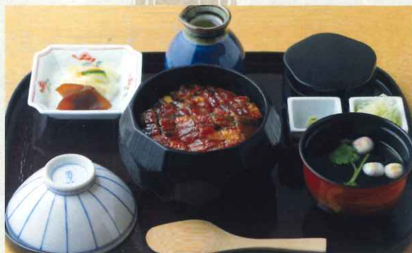
ひつまぶし (0.75尾) (吸物・漬物付)