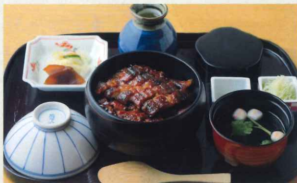
上ひつまぶし (1尾) (肝吸・漬物付)