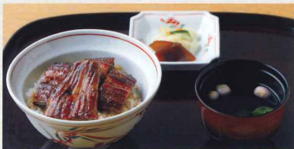
うなぎ丼 (4切) (吸物・漬物付)

お一人様で備長のうなぎを十分に楽しめる 贅沢なひつまぶしをご用意いたしました。 中詰め鰻とご飯を折り重ねております。