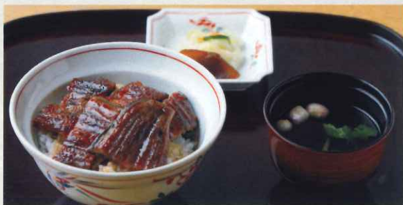
上うなぎ丼 (5切) (肝吸・漬物付)