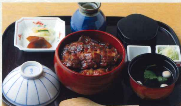
特上ひつまぶし (1.5尾) (肝吸・漬物付)